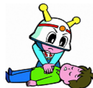
東京消防庁マスコット キュウタくん